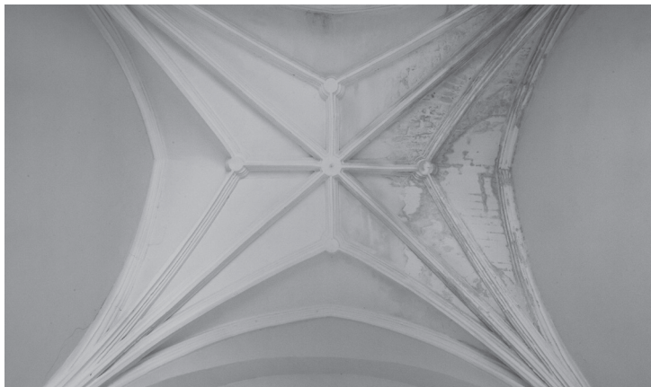
• Bourse du Travail d'Arles • Détail de la voûte de la chapelle latérale. 2019.

D ans une période où notre modèle social arraché par la lutte est attaqué, nous avons besoin de repères tant revendicatifs qu'historiques autour de nos valeurs, de notre histoire, de l'histoire de nos luttes et de nos conquies sociaux.